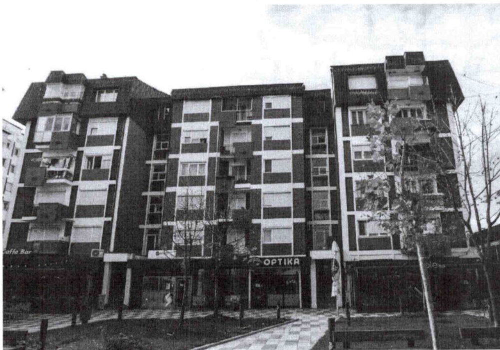
Foto 2. Renoviranje višeporodičnih stambenih objekata u gradu