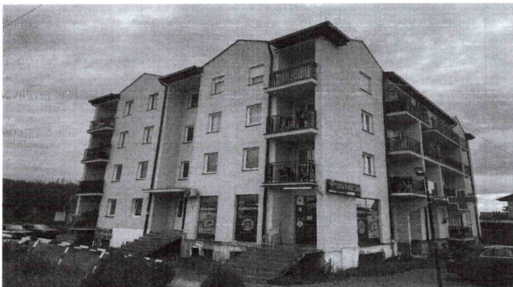
Foto 6. Stambeni objekat „kod Železnice” (u kojem živi 23 porodice)

spoljašnje uređenje ovog objekta kako bi bio pogodan za stanovanje. Ove porodice su identifikovane, ali pravno pitanje njihovog stanovanja i dalje ostaje nerešeno.