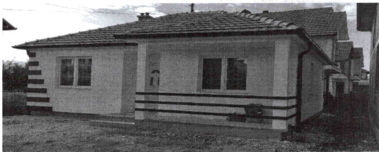
Foto 5. Stambene kuće izgrađene od strane Opštine u sufinansiranju sa udruženjem „Jetimat e Ballkanit“

Ostali objekti u javnoj svojini u kojima stanuju porodice, a čije pitanje vlasništva još uvek nije rešeno, jesu: