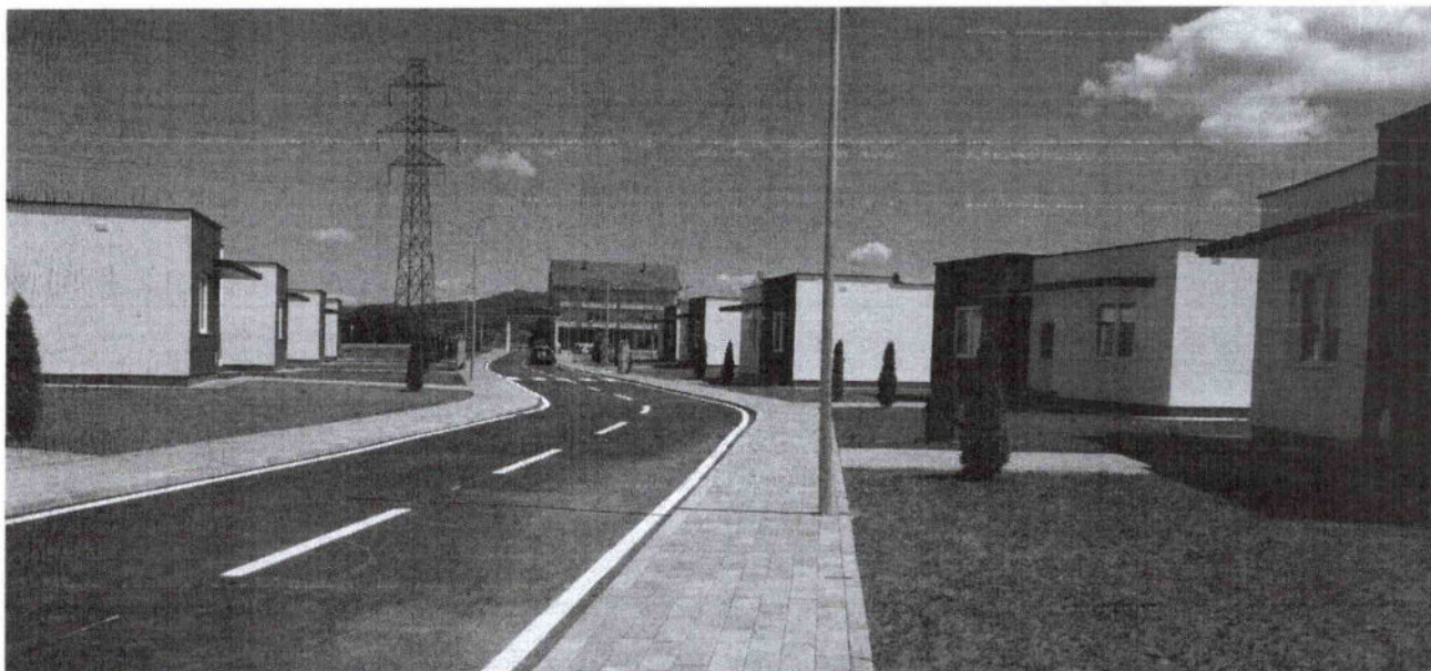
Foto 4. Stambene kuće izgrađene od strane Fondacije „Albanci za Albance“ u saradnji sa Opštinom Podujevo