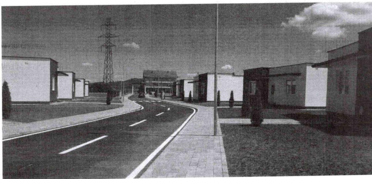
Foto 4. Shtëpitë për banim të ndërtuara nga Fondacioni Shqiptarët për Shqiptarët në bashkëpunim me Komunën e Podujevës