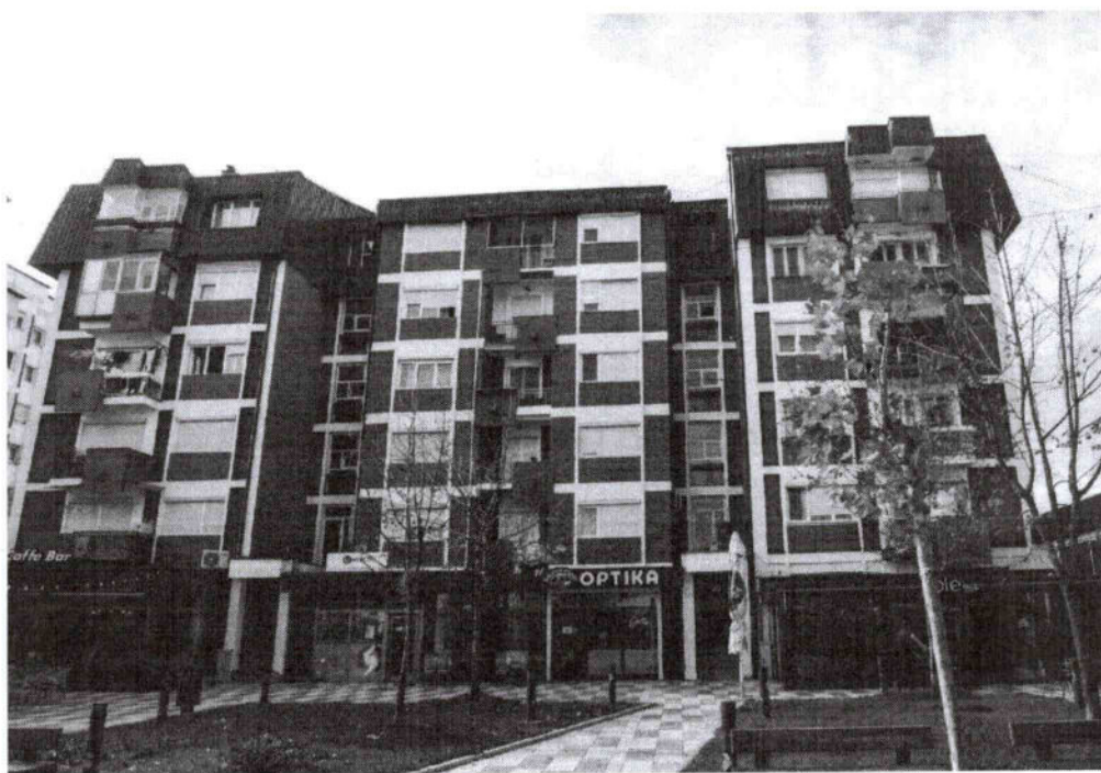
Foto 2. Renovimi i objekteve shumë banesore në qytet