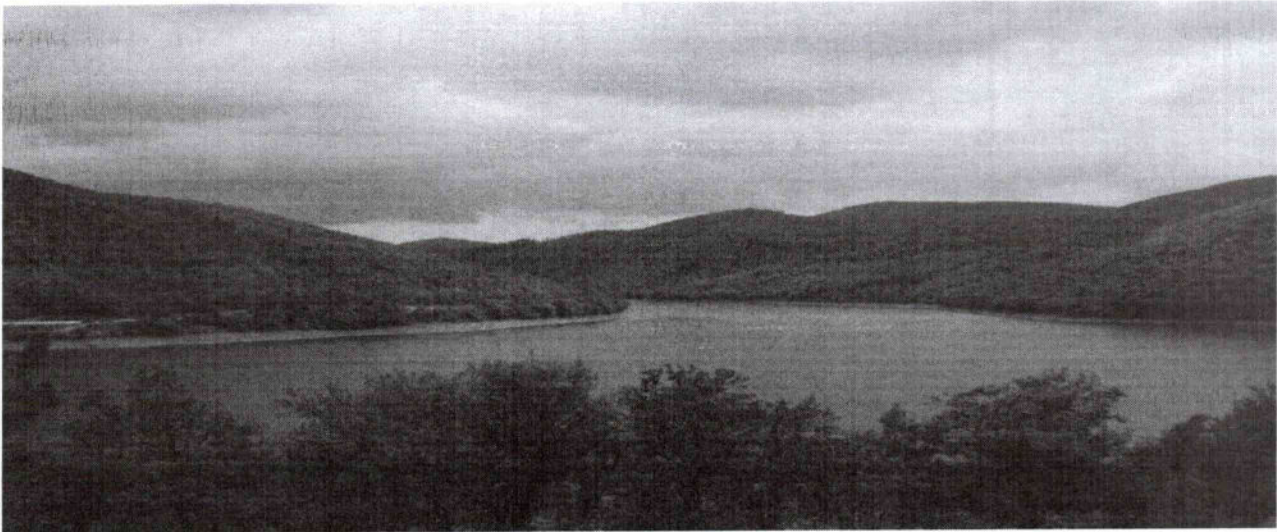
Foto 1. Liqeni i Batllavës