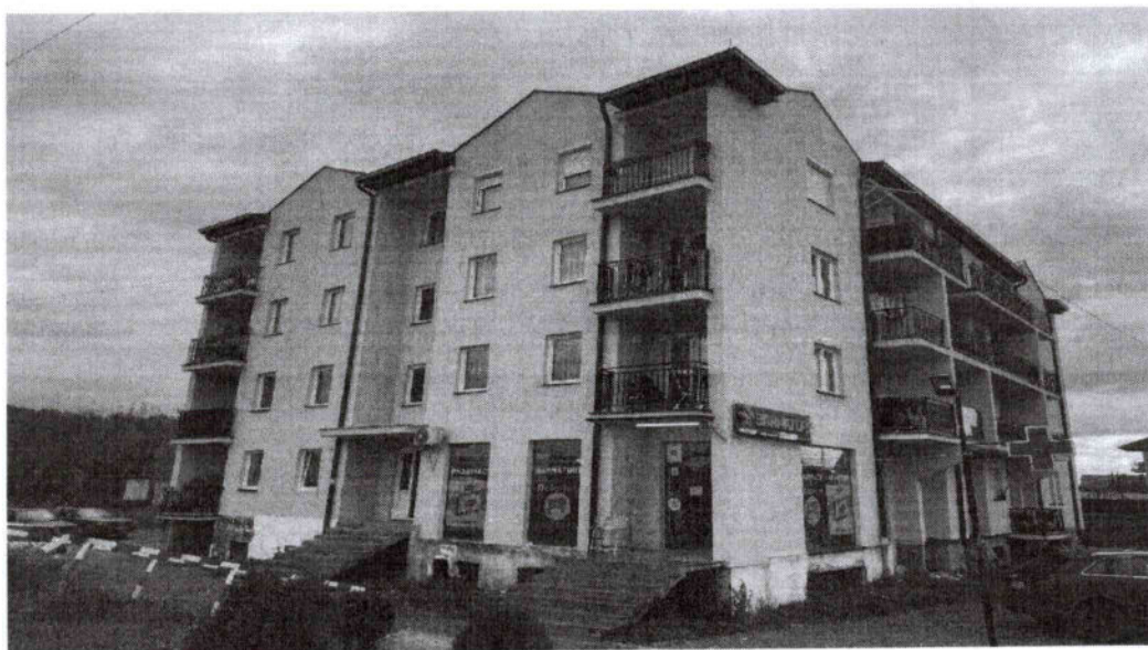
Foto 6. Objekti banesor te Hekurudha" ( në të cilën jetojnë 23 familje)

Në objektin banesor afër stacionit hekurudhor, çështja e pronës është ende e padefinuar. Në këtë objekt janë të vendosura 23 familje që nga koha e pas luftës. Komuna ka investuar në rregullimin e jashtëm të këtij objekti në mënyrë që të jetë i përshtatshëm për banim. Këto familje janë të identifikuara por çështja ligjore e banimit të tyre ende mbetet e pazgjedhur.