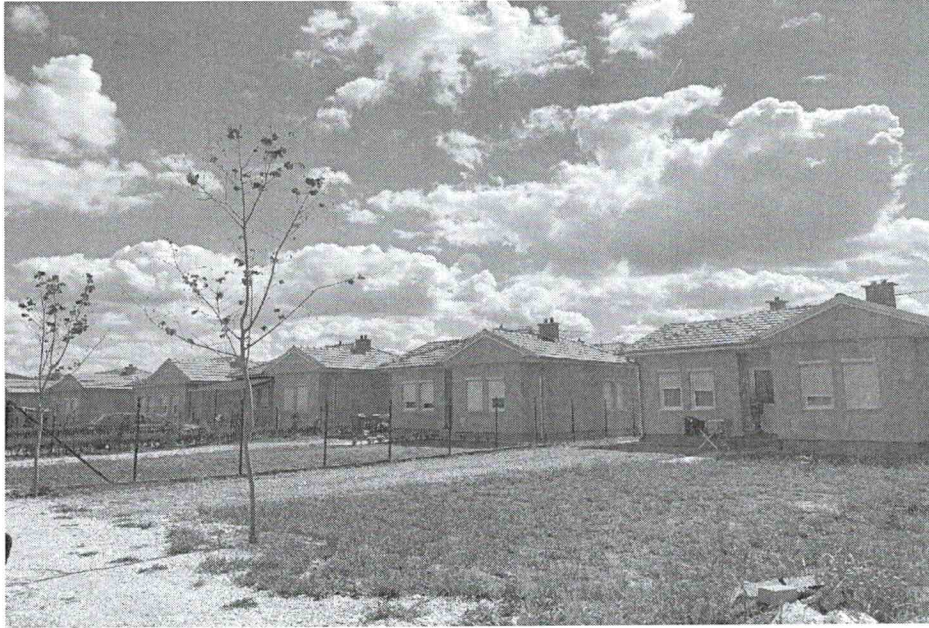
Foto 3. Shtëpitë për banim social në Lagjen e Dëshmorëve