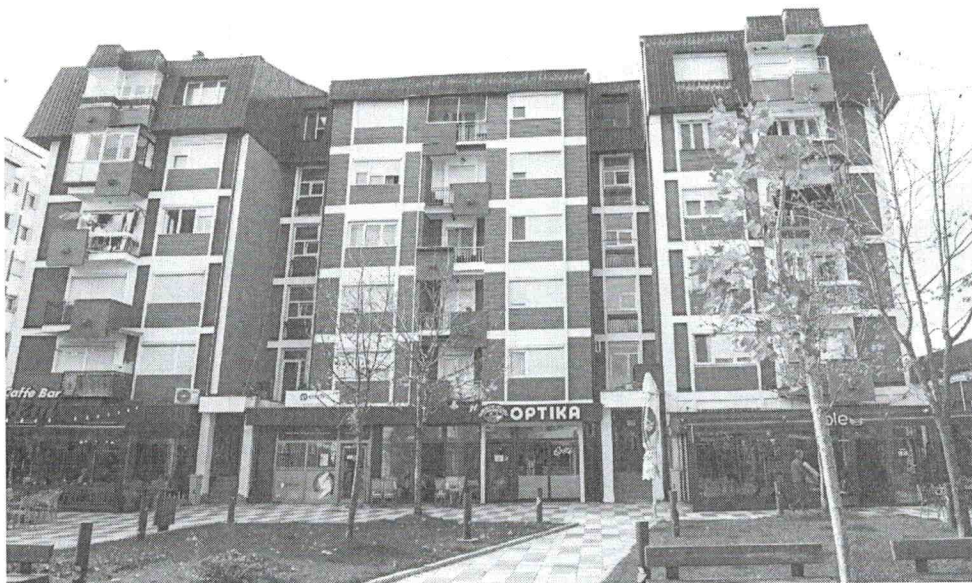
Foto 2. Renovimi i objekteve shumë banesore në qytet