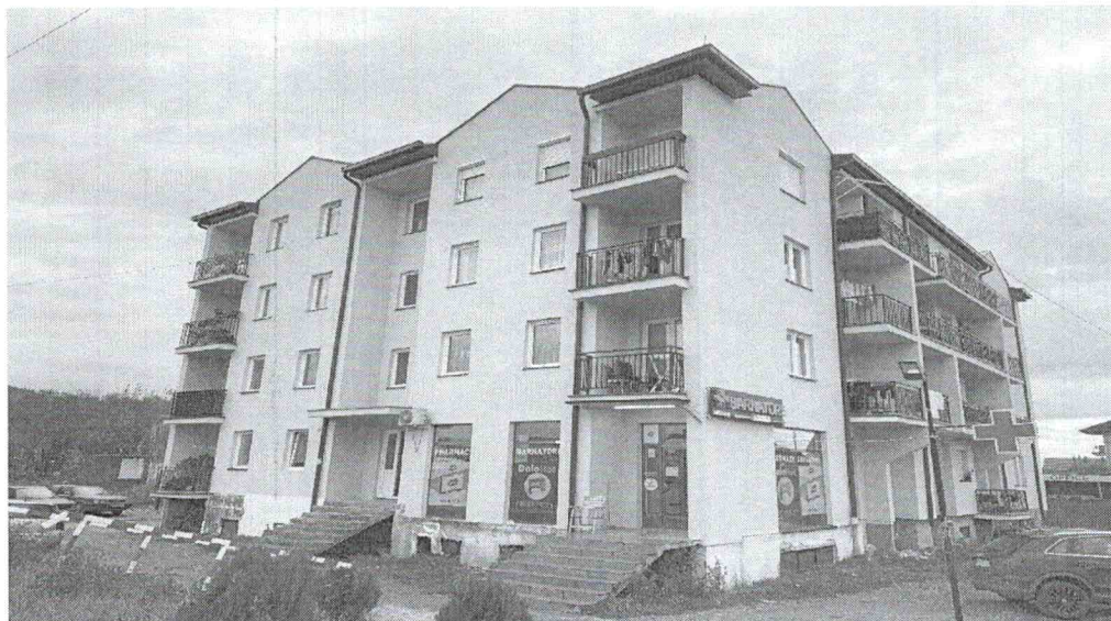
Foto 5. Objekti banesor te Hekurudha” ( në të cilën jetojnë 23 familje)

Gjithashtu kemi tri lokacione pronë komunale në të cilat jetojnë familjet në baraka të ndërtuara nga koha e para luftës. Në rrugën Nuhi Gashi jetojnë 4 familje, në rrugën Hyzri Talla jetojnë 5 familje dhe në objektin ish arkivi historik jeton një familje.