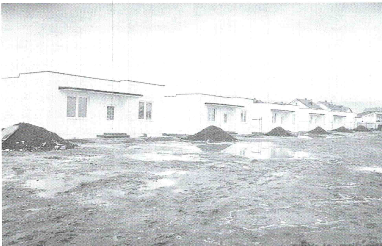
Foto 8. Lagjja në ndërtim e sipër e financar nga shoqata 'Shqiptarët për Shqiptarët'