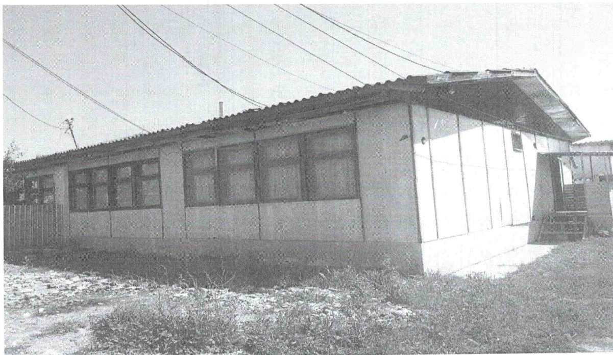
Foto 6. Objekti në rrugën “Hyzri Talla”( në të cilën jetojnë 5 familje)