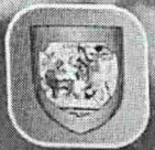
FATLUM OSMANI - Drejtor i Financave