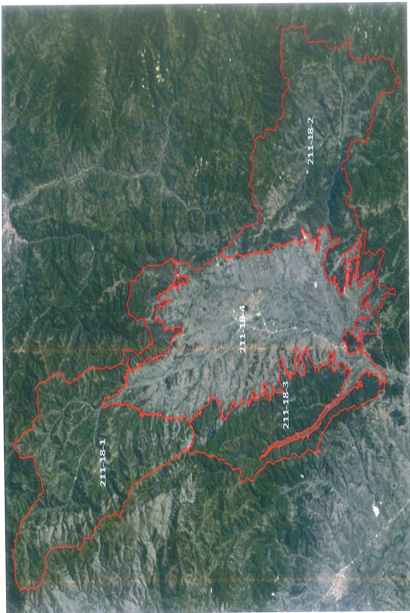
Harta e zonave të vlerave për Prona Pyjore